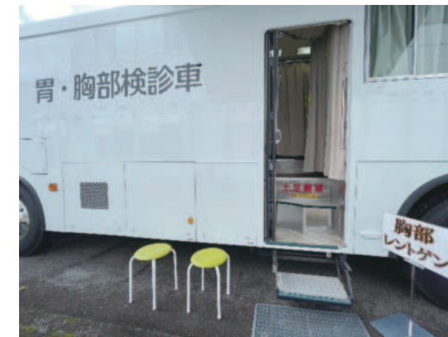
レントゲン検診車

車体の前後で部屋が分かれており、2つの検査を同時に行うことが出来ます。更衣室は3部屋ご用意しており、円滑に検査を進めることが可能です。